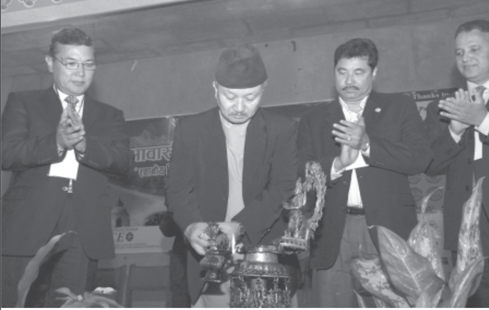
गैरआवासीय नेपाली दिवसको समुद्घाटन गर्नुहुँदै प्रमुख अतिथि संविधान सभाका अध्यक्ष नेम्वाङ

गैर आवासीय नेपाली दिवस २०६७ विविध कार्यक्रमहरूका साथ सम्पन्न भयो। यस वर्षको दिवसको अवसरमा संघद्वारा नेपाल विज्ञान तथा प्रविधि प्रज्ञा प्रतिष्ठान र शिक्षा मन्त्रालयसंग विज्ञान, प्रविधि र खुला विश्व विद्यालय स्थापनाका विषयमा सहकार्य गर्न सहमती गरिएको छ। त्यसैगरी