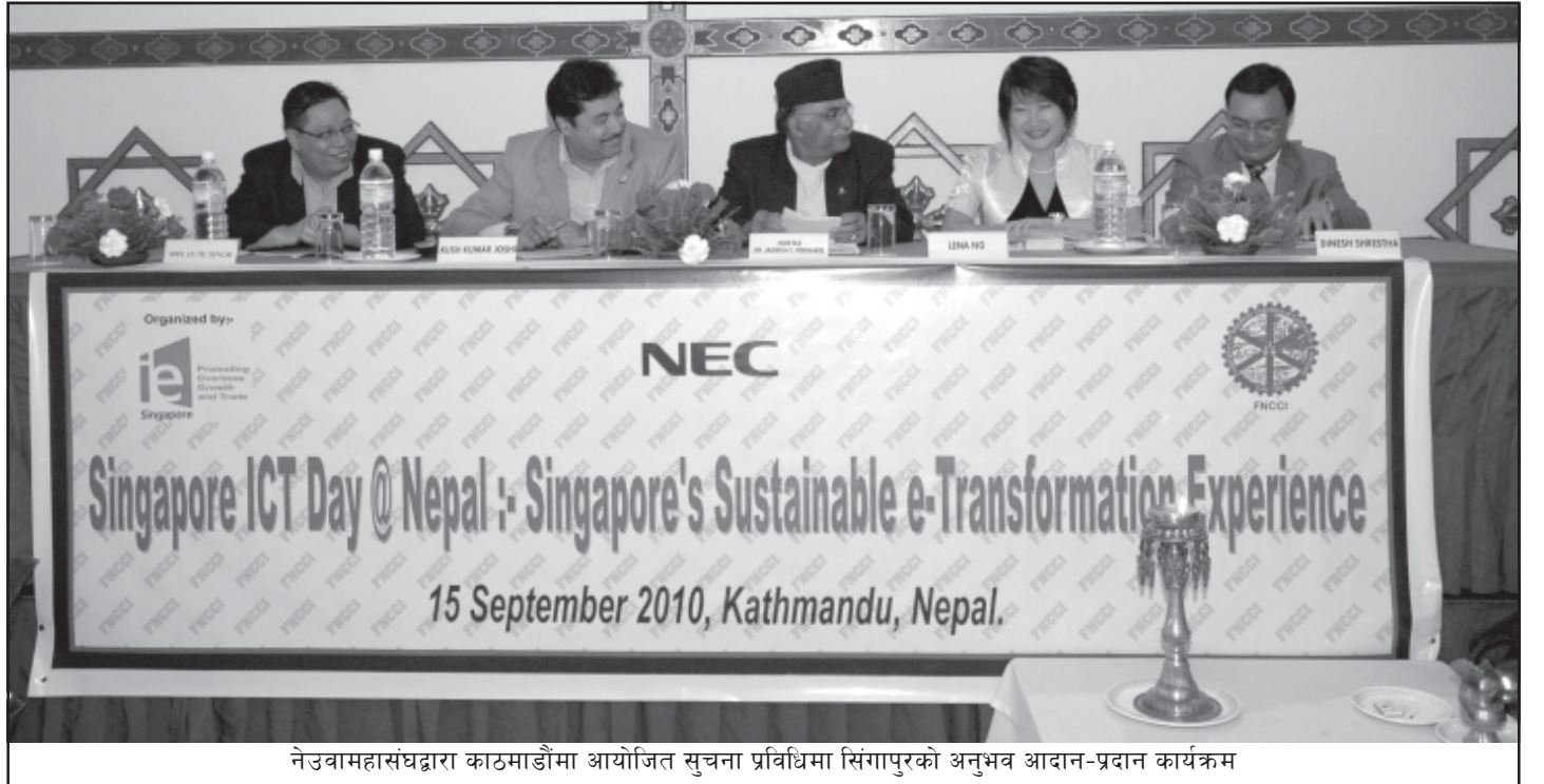
नेउवामहासंघद्वारा काठमाडौंमा आयोजित सुचना प्रविधिमा सिंगापुरको अनुभव आदान-प्रदान कार्यक्रम