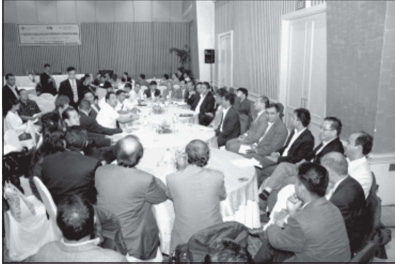
(व्यावसायिक भेटघाटमा दुवै देशका उद्यमीहरू)

४. आपसी सम्बन्ध नयाँ चरणमा प्रवेश गरेकोले आगामी दिनमा द्विपक्षीय आर्थिक व्यापारिक